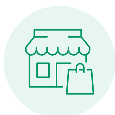
Sales & Process Operations