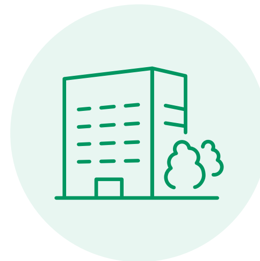
Moderner Campus in Essen