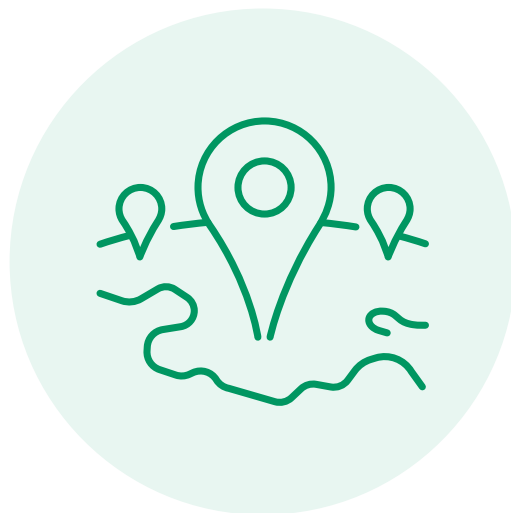
In über 30 Ländern vertreten