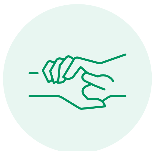
Familienunternehmen seit 1913