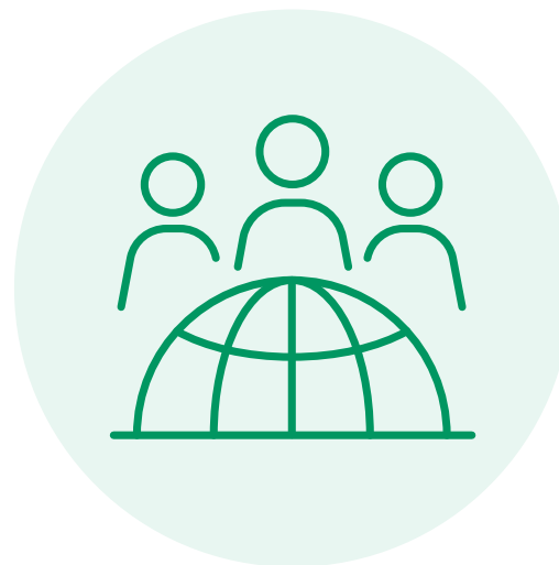
Ca. 50.000 Mitarbeitende