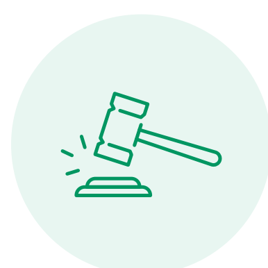
Law & Integrity