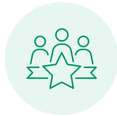
People & Culture