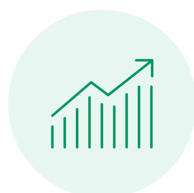
Strategy & Corporate Development